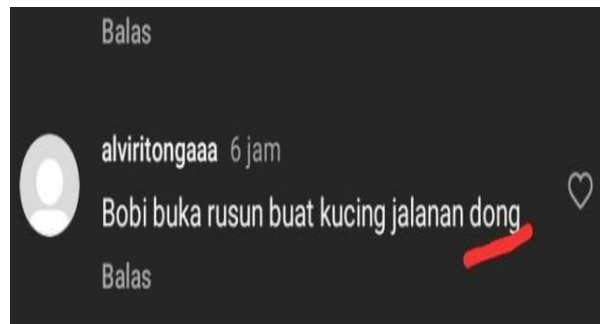
Gambar 7. Komentar

Berikut penjelasan dari dua komentar yang mengandung kata-kata kategori fatis: