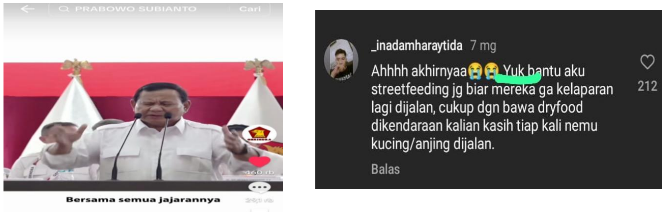
Gambar 1. Komentar

Berdasarkan hasil observasi, pencatatan dan dokumentasi pada akun media sosial Gerindra ternyata terdapat banyak sekali kata dalam kategori fatis yang terdapat di komentar akun media sosial Gerindra.