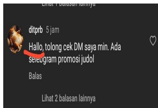
Gambar 4. Komentar

Komentar ini mengandung penggunaan kata "Halo" yang merupakan salah satu contoh kategori fatis. Berikut adalah penjelasan detail tentang kalimat tersebut: