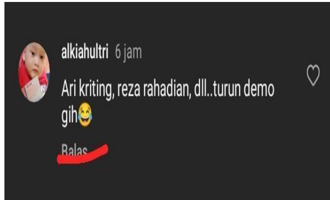
Gambar 6. Komentar

Komentar ini mengandung kata "gih", yang termasuk dalam kategori fatis. Berikut penjelasan tentang kata tersebut dalam konteks komentar ini: