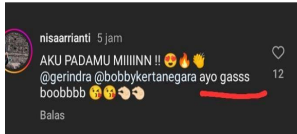
Gambar 2. Komentar

Komentar ini juga mengandung beberapa elemen kategori fatis yang digunakan untuk memperkuat ekspresi dan emosi dalam berkomunikasi. Berikut adalah penjelasan dari setiap elemen dalam komentar tersebut: