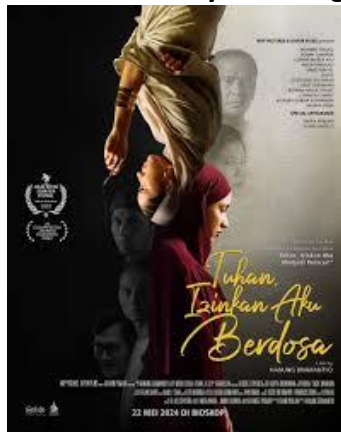
Gambar 1. Official Poster film Tuhan, Izinkan Aku Berdosa

Film Tuhan, Izinkan Aku Berdosa (2024), disutradarai oleh Hanung Bramantyo. Film ini diadaptasi dari novel kontroversial Tuhan, Izinkan Aku Menjadi Pelacur! karya Muhidin Dahlan dan mengangkat tema moralitas, agama, serta kebebasan individu dalam menghadapi tekanan sosial.