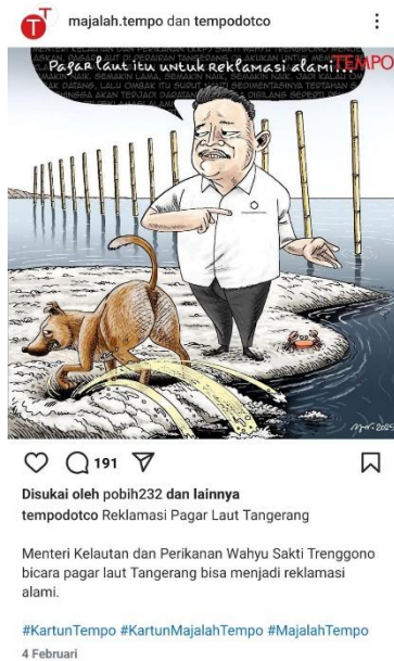
Gambar 1. Reklamasi Pagar Laut Tangerang

Pada ilustrasi komik tersebut kartun politik ini diunggah oleh Majalah Tempo pada 4 Februari 2025 dan mendapatkan 191 komentar dengan tema reklamasi pagar laut. Komik ini muncul pertama kali pada awal bulan Februari. Kartun pada unggahan tersebut menceritakan isu terkait pernyataan Menteri Kelautan dan Perikanan yaitu Pak Wahyu Sakti Trenggono yang mengungkapkan bahwa pagar laut di perairan Tangerang bisa menjadi reklamasi alami. Pada ilustrasi tersebut terdapat beberapa objek gambar di antaranya, dengan latar belakang laut yang di sekitarnya dipasang bambu-bambu yang membentuk menyerupai pagar kemudian dipinggir laut terdapat daratan tan muncul hanya sedikit berdiri seorang laki-laki yang sedang melihat anjing menggali tanah daratan.