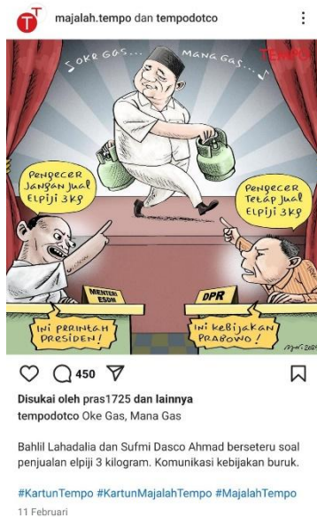
Gambar 2. Komik Majalah Tempo Berjudul “Oke Gas, Mana Gas”