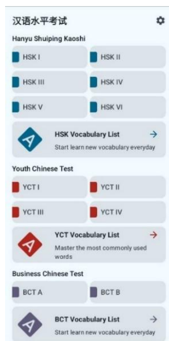
Gambar 1. Fitur Aplikasi HSK Exam

Aplikasi HSK Exam – 汉语水平考试 di Google Play mendapatkan respons beragam dari pengguna dengan rating 4,4 bintang. Banyak pengguna mengapresiasi fitur lengkapnya yang mencakup latihan soal HSK level 1 hingga 6, termasuk bagian mendengarkan, membaca, dan menulis, serta ketersediaan sekitar 5000 kosakata untuk pembelajaran mandiri. Antarmuka yang ramah pengguna dan informasi jadwal ujian juga menjadi nilai tambah. Namun, banyak pengguna mengeluhkan iklan yang mengganggu, bahkan ada yang menyebut iklan menutupi sebagian atau seluruh layar sehingga menghambat penggunaan aplikasi. Beberapa pengguna juga mengalami masalah teknis seperti konten yang tidak muncul atau kesulitan mengakses fitur tertentu. Meskipun demikian, bagi mereka yang mencari alat bantu belajar HSK yang komprehensif, aplikasi ini tetap menjadi pilihan yang layak dengan catatan adanya perbaikan pada aspek teknis dan pengelolaan iklan.