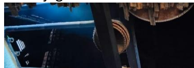
Gambar 4. Daun Tepus

Daun tepus secara semantis adalah bahan lapisan dalam atap. Daun tepus menciptakan atap yang tahan terhadap panas dan hujan, serta memberikan kenyamanan termal di dalam rumah. Daun tepus juga membantu menjaga kelembapan dan kekuatan struktural.