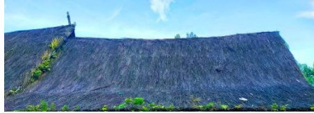
Gambar 9. Suhunan

Menurut Wibowo dan Iswanto (2021), bahwa bentuk atap ini dirancang untuk memaksimalkan aliran air hujan dan sirkulasi udara, menjadikannya sangat sesuai dengan iklim tropis basah. Selain fungsional, bentuk suhunan juga memiliki makna simbolis, sebagai penghubung antara bumi dan langit. Atap ini biasanya ditutup dengan bahan-bahan alami seperti daun kiray atau ijuk, yang berfungsi sebagai insulasi alami terhadap panas.