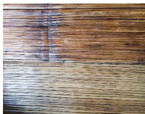
Gambar 2. Awi

Awi secara semantis adalah bahan bangunan rumah. Awi memiliki peran multifungsi dalam konstruksi rumah adat Kampung Naga. Digunakan terutama untuk dinding dalam bentuk anyaman bilik ( gedhek ), lantai berupa palupuh (bilah awi pipih yang disusun rapat), dan elemen struktural seperti golodog , langit-langit, dan kadang sebagai alat pengikat atau tali.