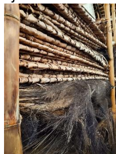
Gambar 5. Ijuk

Ijuk secara semantis adalah bahan untuk melindungi luar atap. Sama seperti daun tepus, ijuk juga menciptakan atap yang tahan terhadap panas dan hujan, serta memberikan kenyamanan termal di dalam rumah. Selain itu, ijuk mampu menyerap panas di siang hari dan melepaskannya kembali di malam hari. Struktur ijuk yang berpori juga berfungsi sebagai ventilasi alami yang memungkinkan asap dapur keluar dengan lancar, tanpa menggunakan cerobong. Prinsip ini didukung oleh hukum Bernoulli, di mana asap panas yang lebih ringan akan naik dan keluar melalui celah-celah ijuk.