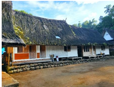
Gambar 1. Rumah Adat

Rumah adat Kampung Naga dibangun dalam bentuk panggung untuk menyesuaikan dengan kondisi geografis yang berbukit dan memiliki kelembaban tinggi. Bentuk panggung memungkinkan ventilasi alami di bawah rumah dan menghindari kerusakan akibat air serta binatang. Selain itu, struktur ini dianggap menjaga kesucian ruang dalam rumah karena tidak langsung bersentuhan dengan tanah.