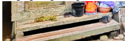
Gambar 6. Golodog

Golodog secara semantis adalah anak tangga dari kayu yang menghubungkan tanah dengan lantai rumah. Jumlahnya biasanya ganjil (tiga atau lima), sebagai simbol keseimbangan. Golodog diletakkan di bawah dan di depan pintu depan serta pintu dapur yang terbuat dari papan. Selain dari papan, golodog di Kampung Naga dibuat dari bambu, tetapi ada juga yang meletakkan batu sebagai ganti golodog tersebut.