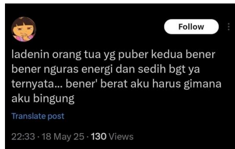
Gambar 6. Representasi emosional dalam cuitan X (Twitter) komunitas sedih-sedih

Pada cuitan di atas sender mengirim cuitan yang mengungkapkan bahwa sender sedang merasa sangat sedih, lelah, dan kebingungan menghadapi orang tuanya yang sedang mengalami "puber kedua". Cuitan tersebut menggambarkan fase di mana orang tua mengalami krisis identitas serta berkeinginan untuk merasa muda kembali. Kata "nguras energi" menunjukkan bahwa pengirim atau sender merasa kewalahan secara mental karena harus terus-menerus menghadapi perubahan sikap dan kebutuhan emosional orang tuanya. Secara keseluruhan cuitan ini mencerminkan kondisi mental yang campur aduk, penuh tekanan, dan tanpa arahan sehingga pengirim atau sender merasa terjebak di antara perannya sebagai anak dan dinamika emosional orang tuanya.