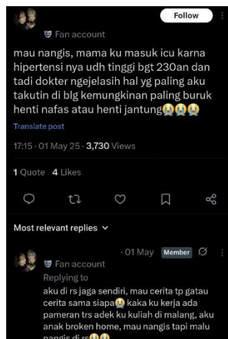
Gambar 2. Representasi emosional dalam cuitan X (Twitter) komunitas sedih-sedih