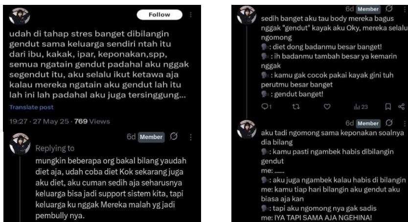
Gambar 5. Representasi emosional dalam cuitan X (Twitter) komunitas sedih-sedih

Pada cuitan di atas emosi yang disampaikan sender merepresentasikan emosi sedih, kecewa, dan marah. Emosi kesedihan dan kekecewaan mendominasi dalam cuitan tersebut karena seharusnya keluarga yang menjadi tempat yang aman dan pendukung dalam kehidupan sender , tetapi justru menjadi pelaku yang menyakiti perasaannya. Adapun emosi marah yang terpendam muncul secara eksplisit di bagian akhir cuitan ketika ia membalas ponakannya dengan kalimat “IYA TAPI SAMA SAJA NGEHINA”. Secara keseluruhan cuitan ini mencerminkan luka emosional akibat perlakuan keluarganya sendiri. Semua emosi yang