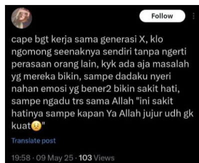
Gambar 3. Representasi emosional dalam cuitan X (Twitter) komunitas sedih-sedih

Pada cuitan di atas emosi yang disampaikan oleh sender adalah frustrasi, lelah, dan sakit hati. Frustrasi adalah emosi kekecewaan yang disebabkan oleh hambatan dalam mencapai tujuan atau ekspektasi akan suatu peristiwa yang membatasi tujuan seseorang (Tyas et al., 2025). Dalam cuitan terlihat bahwa keluhan yang disampaikan sender menunjukkan emosi frustrasi. Kemudian sender juga merasa lelah terbukti dari ungkapan “cape bgt kerja sama generasi X” dan “jujur udh gk kuat”. Selain itu ada emosi sakit hati yang muncul dalam cuitan tersebut terbukti dari kalimat “bener2 bikin sakit hati”. Secara keseluruhan dalam cuitan ini meluapkan emosi sender yang sudah berada di titik lelah secara emosional karena interaksi antar sesama teman kerja di lingkungan pekerjaannya.