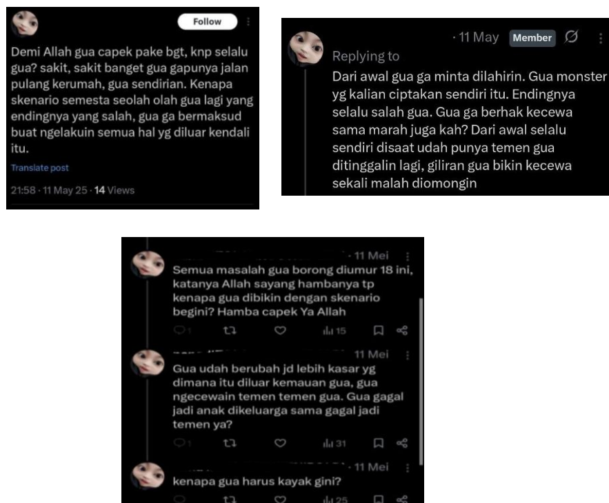
Gambar 7. Representasi emosional dalam cuitan X (Twitter) komunitas sedih-sedih