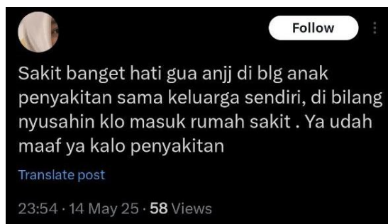
Gambar 4. Representasi emosional dalam cuitan X (Twitter) komunitas sedih-sedih

Pada cuitan di atas emosi yang disampaikan sender menunjukkan emosi kecewa, sedih, sakit hati, dan rasa bersalah. Sender merasa kecewa dan sedih karena disalahkan oleh keluarganya sendiri atas penyakitnya yang sender sendiri juga tidak mau merasakan seperti itu. Rasa bersalah muncul dari dalam hati sender atas kondisi kesehatannya yang berada di luar kehendaknya. Selain itu, rasa sakit hati juga timbul karena sender disebut sebagai anak penyakitan. Hal itu tercantum dalam cuitan di atas “sakit hati gua anjj di blg anak penyakitan sama keluarga sendiri”. Secara keseluruhan ungkapan dalam cuitan tersebut sender atau pengirim mengungkapkan rasa sakit hati karena orang-orang terdekat, yaitu keluarganya sendiri yang membuat diri sender merasa tidak berharga dan bersalah karena kondisi kesehatannya.