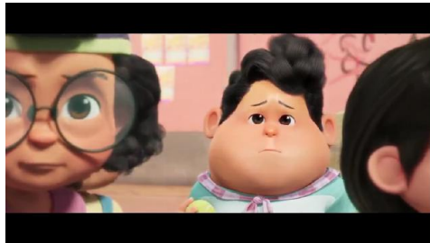
Gambar 3. Don sedih saat diremehkan oleh teman-temannya.