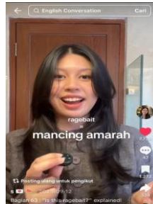
“Gambar 2. Tangkapan Layar Penggunaan Slang Ragebait di Akun @bigsummerbl0wout

Analisis terhadap temuan kedua dari akun @bigsummerbl0wout menunjukkan bahwa istilah “Ragebait” menggambarkan dinamika fungsi bahasa di media sosial. Istilah ini digunakan sebagai alat provokasi untuk memicu emosi demi meningkatkan keterlibatan pengguna. Fenomena tersebut sejalan dengan kajian sosiolinguistik yang melihat bahasa sebagai praktik sosial yang terus berubah. Penggunaan kata ini membuktikan bahwa konflik serta emosi kini menjadi strategi komunikasi bernilai ekonomi. Oleh sebab itu, pembahasan istilah tersebut sangat relevan diintegrasikan dalam pembelajaran sosiolinguistik.