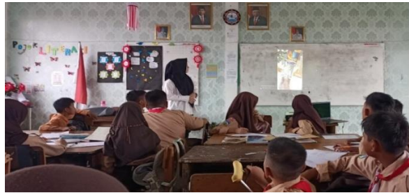
Gambar 2. Siswa Menyimak Video Tik Tok

Pada saat video Tik Tok milik saviramalik dengan judul membuat cemilan quality time berdurasi 1 menit ditayangkan para siswa dengan antusias menyimak tayangan video tersebut dari awal hingga akhir dengan tenang dan saksama. Guru juga ikut mendampingi para siswanya menyimak video Tik Tok yang sedang ditayang. Setelah selesai menyimak tayangan video Tik Tok guru sedikit mengulas kembali isi dari tayangan video yang telah ditampilkan.