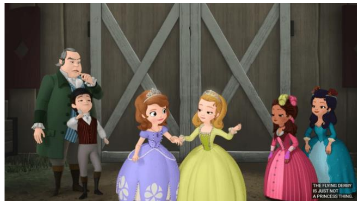
Gambar 2. (3.27)

Pelabelan merupakan suatu stereotip merupakan suatu fenomena yang hingga saat ini masih melekat kuat dalam ruang lingkup masyarakat. Pelabelan yang dimaksud merupakan pemberian label atau cap tertentu pada seseorang atau kelompok berdasarkan asumsi-asumsi yang bahkan tidak selalu berdasar. Pelabelan ini mengakibatkan berbagai macam kerugian bagi pihak yang di-label.