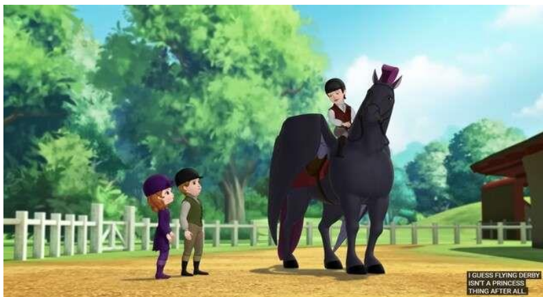
Gambar 3. (10:09)

Subordinasi merupakan salah satu bentuk diskriminasi gender dimana subordinasi merujuk pada praktik penempatan posisi perempuan lebih rendah dibandingkan dengan laki-laki dalam hal sosial, ekonomi maupun secara politik. Contoh mengenai subordinasi yang terjadi terdapat pada menit 10:09, dengan dialog “I guess flying derby isn't a princess thing after all” yang menunjukkan adanya anggapan bahwa kegiatan bermain kuda terbang bukanlah sesuatu yang pantas dilakukan oleh seorang putri, menciptakan sebuah Batasan yang ketat terhadap apa yang seharusnya diperbolehkan bagi perempuan. Tindakan ini mencerminkan anggapan bahwa perempuan, termasuk Putri Sofia, tidak memiliki hak yang sama untuk ikut terlibat dalam hal aktivitas yang dianggap maskulin atau pemberani. Pangeran Hugo dengan pandangan sempitnya, mengabaikan kemampuan serta keinginan Putri Sofia, menegaskan posisi subordinatnya di dalam narasi tersebut.