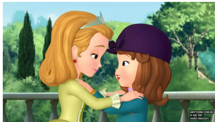
Gambar 5. (21:32)

Dalam episode ini, beban ganda yang dialami oleh Putri Sofia mencerminkan tantangan yang sering dialami oleh perempuan, terutama dalam konteks peran tradisional dan harapan masyarakat. Sebagai seorang Putri, Putri Sofia diharapkan untuk memenuhi peran tertentu yang mencakup sikap Anggun dan lembut. Tuntutan ini seringkali membatasi kebebasannya dalam mengeksplorasi minat serta kegiatan yang lebih aktif atau dianggap “maskulin.” Dengan ekspektasi ini, Putri Sofia terjebak dalam dilemma antara memenuhi harapan orang lain atau mengikuti keinginannya sendiri.