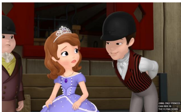
Gambar 1. (3:19)

Marginalisasi merupakan sebuah bentuk diskriminasi yang terjadi karena adanya perbedaan gender, dimana satu pihak dikesampingkan posisi serta perspektifnya. Dalam hal ini, marginalisasi seringkali terjadi pada perempuan yang perspektifnya diabaikan atau dianggap tidak penting daripada laki-laki.